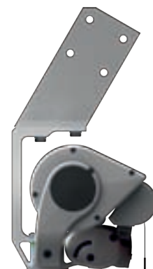
Die Dachsparrenbefestigung der »ERHARDT BS-H«