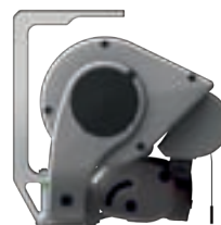
Die Deckenbefestigung der »ERHARDT BS-H«