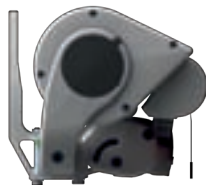
Die Wandbefestigung der »ERHARDT BS-H«

Die Erhardt BS Gelenkarm-Markise kann problemlos an der Wand, unter Decken bzw. Balkonen oder am Dachsparren befestigt werden.