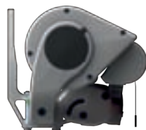
Die Wandbefestigung der »ERHARDT BS-H«

Die Erhardt BS Gelenkarm-Markise kann problemlos an der Wand, unter Decken bzw. Balkonen oder am Dachsparren befestigt werden.