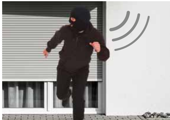
Sicherheitsstufe 3 Keine Gelegenheit für Diebe: Zusätzlich eingebaute GENIO Näherungssensoren